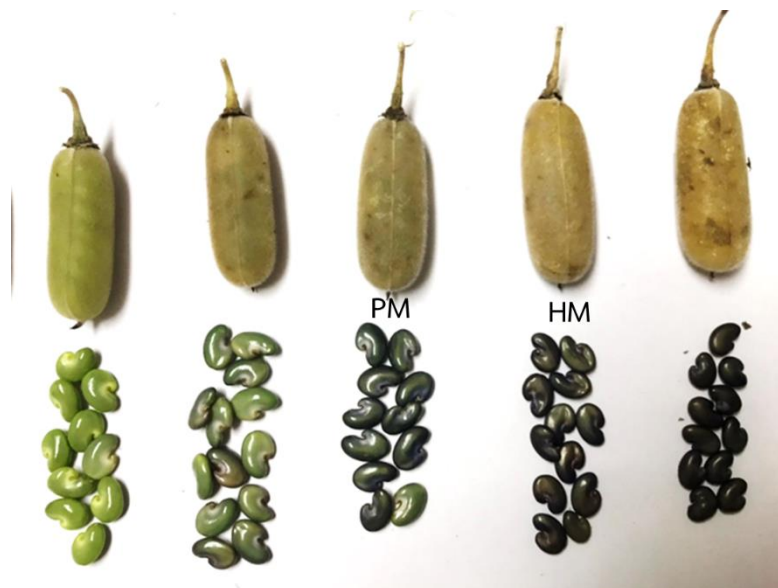
ภาพที่ 2 ลักษณะของฝัก และเมล็ดปอเทืองที่สุกแก่ระยะต่างๆ

ความชื้นเฉลี่ยของเมล็ดปอเทืองที่ระยะแก่ทางสรีรวิทยาเท่ากับ 42.58% ซึ่งสอดคล้องกับการศึกษาอื่นๆ ที่พบว่าความชื้นของเมล็ดพันธุ์ที่แก่ในระยะนี้ จะมีความชื้นประมาณ 40% (สุเทวี, 2545)