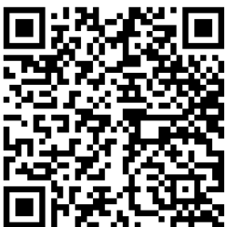
QR-Code ไฟล์เอกสารประกอบการรายงานผลฯ