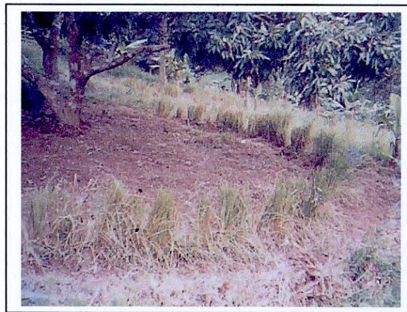
การปลูกหญ้าแฝกรอบโคนต้นไม้ผล

1.5 การปลูกหญ้าแฝกรอบโคนต้นไม้ผล การปลูกในสวนไม้ผลระยะที่ไม้ผลยังไม่โต หรือปลูกก่อนที่จะปลูกไม้ผล ระยะห่างของแถวหญ้าแฝกจะขึ้นอยู่กับระยะปลูกของไม้ผล โดยปลูกแถวหญ้าแฝกขนานไปกับแถวของไม้ผลมีระยะห่างจากต้นไม้ผลพอประมาณ เช่น 1.5 เมตร แถวหญ้าแฝกจะช่วยป้องกันดินพังทลายและรักษาความชุ่มชื้นของดิน การตัดใบหญ้าแฝกบ่อยๆและนำไปหญ้าแฝกมากคลุมโคนต้นไม้ผล จะเป็นการช่วยเพิ่มประสิทธิภาพในการรักษาความชุ่มชื้นและความอุดมสมบูรณ์ของดินเพิ่มขึ้น