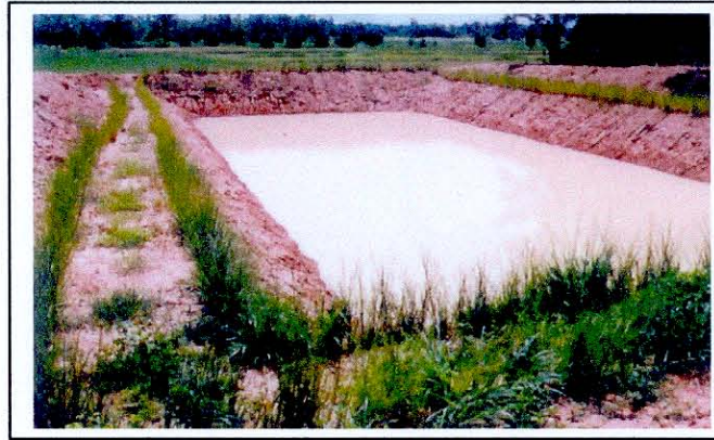
การปลูกหญ้าแฝกรอบขอบสระน้ำ

1.2 การปลูกหญ้าแฝกรอบขอบสระน้ำ เป็นการปลูกหญ้าแฝกตามแนวระดับขวางความลาดเทบริเวณขอบสระน้ำ โดยเริ่มจากแนวแรกที่ระดับน้ำสูงสุดที่น้ำท่วมถึง 1 แนว และปลูกเพิ่มขึ้นอีก 1 หรือ 2 แนว เหนือแนวแรกแล้วแต่ความลึกของขอบสระ เพื่อกรองตะกอนดินที่ถูกพัดพามากับน้ำไหลบ่าไม่ให้มาตกทับถมในสระน้ำ ให้ติดค้างอยู่ที่แถบหญ้าแฝก และระบบรากของหญ้าแฝกยังช่วยยึดดินรอบๆ ขอบสระไม่ให้เกิดการพังทลาย