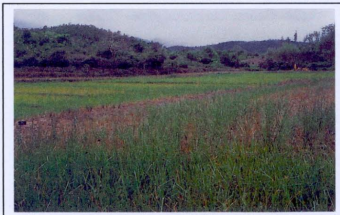
การปลูกลงดินในที่นา

3. การปลูกลงดินในที่นา กล้าหญ้าแฝกที่มีคุณภาพจะได้จากแปลงขยายพันธุ์ที่มีการดูแลรักษาเป็นอย่างดีและมีอายุพอเหมาะ เช่นตั้งแต่ 4 เดือนขึ้นไปและไม่ควรเกิน 1 ปี ดังนั้นการขยายพันธุ์หญ้าแฝกเพื่อเพิ่มปริมาณหน่อหรือจำนวนต้นต่อกอให้มากขึ้นและทันต่อความต้องการในการผลิต การปักชำกล้าหญ้าแฝกจึงเป็นขั้นตอนที่สำคัญ การขยายพันธุ์ด้วยวิธีการปลูกลงดินในพื้นที่นาจะทำในพื้นที่ที่มีการชลประทาน มีการจัดระบบการให้น้ำและระบายน้ำได้เป็นอย่างดี สามารถขยายพันธุ์หญ้าแฝกได้ตลอดปีหรือเป็นพื้นที่นาดอนอาศัยน้ำฝนสามารถระบายน้ำได้ง่าย