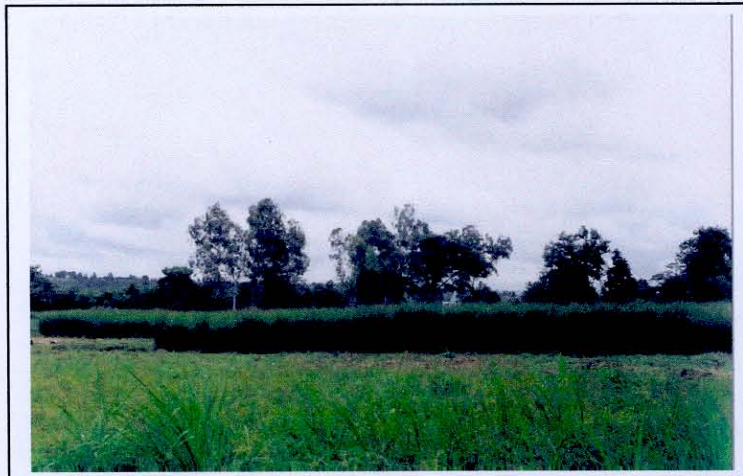
การปลูกลงดินในแปลงขนาดใหญ่

2. การปลูกลงดินในแปลงขนาดใหญ่ วิธีการนี้เป็นการขยายพันธุ์แปลงใหญ่เหมาะสำหรับหน่วยงานหรือเกษตรกรรายใหญ่ที่ต้องการใช้ต้นกล้าหญ้าแฝกจำนวนมาก และเป็นวิธีที่เหมาะสมสำหรับพื้นที่ที่ไม่มีการชลประทาน ขั้นตอนในการดำเนินการคล้ายคลึงกับวิธีการที่ 2 คือหลังการไถพรวนพื้นที่เป็นอย่างดีแล้ว จะนำหน่อพันธุ์หญ้าแฝกที่เตรียมไว้ปลูกลงในแปลงในขณะที่ดินมีความชุ่มชื้น ควรใช้หน่อพันธุ์หลุมละ 2-3 หน่อ โดยใช้ระยะปลูก 50 x 50 เซนติเมตร และเพื่อความสะดวกในการดูแลรักษา ควรปลูกเป็นแถวตามระยะปลูกดังกล่าว จำนวน 6 แถว และเว้นสำหรับเป็นทางเดิน 1 - 1.5 เมตร สลับกันไป การดูแลรักษาและการใส่ปุ๋ยเช่นเดียวกับการปลูกแบบยกร่อง ส่วนฤดูกาลที่เหมาะสมในการขยายพันธุ์แบบนี้ ควรดำเนินการในช่วงกลางฤดูฝน หรือระหว่างกลางเดือนมิถุนายนถึงกลางเดือนสิงหาคม การขยายพันธุ์โดยวิธีนี้ เมื่อหญ้าแฝกมีอายุ 4-5 เดือน จะให้ผลผลิตหน่อหญ้าแฝกเฉลี่ยกอละ 50 หน่อ