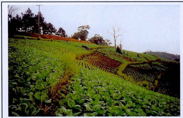
การปลูกหญ้าแฝกเป็นแถบบางความลาดเทของพื้นที่

1.1 การปลูกหญ้าแฝกเป็นแถบบางความลาดเทของพื้นที่ทดแทนคันดินและคูรับน้ำขอบเขาเพื่อการอนุรักษ์ดินและน้ำ โดยการปลูกหญ้าแฝกเป็นแถวตามระดับความลาดเทของพื้นที่ให้มีระยะห่างระหว่างแถวประมาณ 6 – 8 เมตร และมีระยะห่างระหว่างต้น 5 เซนติเมตร ถ้ากล้าหญ้าแฝกเป็นแบบรากเปลือย และระยะห่างระหว่างต้น 10 เซนติเมตร กล้าหญ้าแฝกเป็นแบบเพาะชำในถุงพลาสติกดำ เมื่อหญ้าแฝกที่ปลูกเจริญเติบโตแตกกอเบียดชิดติดกันภายใน 4 – 6 เดือน ควรตัดใบหญ้าแฝกให้ต้นหญ้าแฝกสูงประมาณ 30 – 50 เซนติเมตร เพื่อเร่งให้มีการแตกกอ เมื่อแตกกอเบียดกันแน่นเหมือนกำแพง สามารถกรองเศษพืชและตะกอนดิน ซึ่งถูกน้ำไหลบ่าหน้าดินพัดพามาตกทับถมติดอยู่กับกอหญ้าแฝกเกิดเป็นคันดินตามธรรมชาติได้