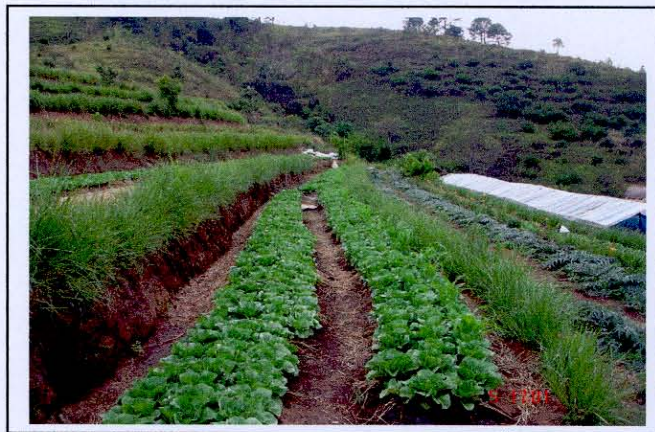
การปลูกหญ้าแฝกเสริมมาตรการอนุรักษ์ดินและน้ำ