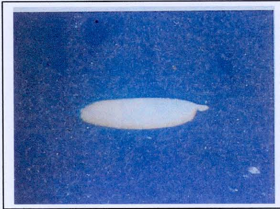
เมล็ดพันธุ์หญ้าแฝก

5. เมล็ดและต้นกล้า ( Seed and Seedling ) ดอกหญ้าแฝกเมื่อได้รับการผสมแล้ว ดอกที่ไม่มีก้านดอกซึ่งเป็นดอกสมบูรณ์ก็จะติดเมล็ด เมล็ดสีน้ำตาลอ่อนเป็นรูปกระสวยผิวเรียบหัวท้ายมน เนื้อในลักษณะคล้ายแป้งเหนียวจึงสูญเสียสภาพความงอกได้ง่ายเมื่อถูกลมแรง แดดจัด หรือสภาพอากาศวิกฤติ เนื้อแป้งเปลี่ยนเป็นแข็งรัดตัวทำให้ไม่สามารถขยายตัวได้ เนื่องจากเมล็ดหญ้าแฝกมีความสามารถในการงอกอยู่ในช่วงระยะเวลาจำกัดเพียงช่วงสั้นๆ และบางสายพันธุ์ซึ่งนำเข้าจากต่างประเทศไม่มีเมล็ด จึงทำให้หญ้าแฝกไม่สามารถจะแพร่กระจายกลายเป็นวัชพืชร้ายแรงได้