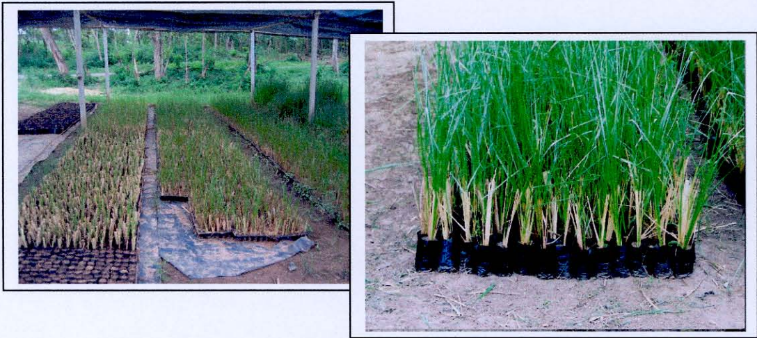
การขยายพันธุ์โดยการปลูกลงถุงพลาสติก

คัดรากให้สั้นแยกออกเป็นหน่อตั้งแต่ 2-3 หน่อ นำมาปลูกในถุงที่จัดเตรียมไว้ ควรปลูกในขณะที่ดินในถุงมีความชุ่มชื้นดี และควรมีการให้น้ำอย่างสม่ำเสมอและต่อเนื่อง บริเวณแปลงเพาะชำกล้าหว่านแฉกต้องมีการพรางแสงด้วยตาข่ายพรางแสงได้ 70 เปอร์เซ็นต์ ใช้ปุ๋ยสูตร 25-5-5 อัตรา 1 ช้อนแกงต่อน้ำ 20 ลิตร ในระยะแรกและสัปดาห์ต่อไปใช้ปุ๋ยสูตร 15-15-15 อัตราครึ่งช้อนชาต่อถุงขนาดใหญ่ และอัตรา 100 กรัมต่อ 10 ตารางเมตร สำหรับถุงขนาดเล็กและรดน้ำให้ชุ่มอยู่เสมอ สำหรับหว่านแฉกในถุงขนาดใหญ่หลังจากอายุ 2 เดือนเป็นต้นไปเริ่มแตกกออย่างรวดเร็วควรมีการให้น้ำให้ปุ๋ยอย่างเต็มที่ อายุ 4 เดือนขึ้นไปควรตัดใบให้เหลือความยาวประมาณ 40 เซนติเมตร เพื่อป้องกันหว่านแฉกไม่ให้แก่เกินไป สำหรับหว่านแฉกที่เพาะชำในถุงขนาดเล็กเมื่อกล้าอายุ 45 วันขึ้นไปก็พร้อมที่จะนำไปปลูกได้ซึ่งจะแตกหน่อ 3-5 หน่อ รากกระจายทั้งถุง ก่อนนำไปปลูกควรมีการเดือนโดยการลดการให้น้ำลงเพื่อให้กล้าหว่านแฉกแข็งแรง