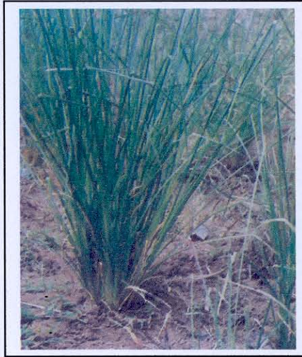
ลักษณะของกอหญ้าแฝก

2. ใบ ( Leaf ) ใบของหญ้าแฝกจะแตกออกจากโคนกอ มีลักษณะแคบยาวขอบใบขนานปลายสอบแหลมแผ่นใบกว้างคายน โดยเฉพาะใบแก่ขอบและเส้นกลางใบมีหนามละเอียด ( spinulose ) หนามบนใบที่ส่วนโคนและกลางแผ่นจะมีน้อยแต่จะมีมากที่บริเวณปลายใบมีลักษณะตั้งทแยงปลายหนามชี้ขึ้นไปทางปลายใบ กระจิ่งหรือเยื่อกันน้ำฝนที่โคนใบ ( Ligule ) จะลดรูปมีลักษณะเป็นเพียงส่วนโค้งของขนสั้นละเอียด บางครั้งสังเกตได้ไม่ชัดเจน