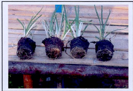
การขยายพันธุ์แบบกิ่งเปลือยราก (semi - bare root)