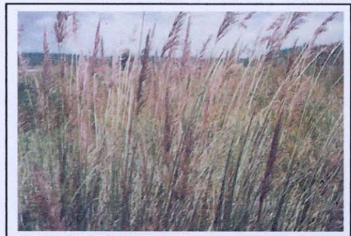
ลักษณะช่อดอกหญ้าแฝก

4. ช่อดอก ( Inflorescence ) หญ้าแฝกมีช่อดอกตั้งลักษณะเป็นรวง ก้านช่อดอกยาวกลม ก้านและช่อดอกสูงประมาณ 1 – 1.5 เมตร แต่ในต้นที่สมบูรณ์จะสูงจากพื้นดินเกินกว่า 2 เมตร เฉพาะส่วนช่อดอกหรือรวงสูงประมาณ 20 – 40 เซนติเมตร แผ่กว้างเต็มที่ 10 - 15 เซนติเมตร ช่อดอกของหญ้าแฝกหอมส่วนใหญ่มีสีม่วงซึ่งมีลักษณะปกติประจำแต่ละชนิดพันธุ์ ดอกหญ้าแฝกจะเรียงตัวอยู่ด้วยกันเป็นคู่ๆ มีลักษณะคล้ายคลึงและขนาดใกล้เคียงกันแต่ละคู่ประกอบด้วยดอกชนิดที่ไม่มีก้านและดอกชนิดมีก้าน ยกเว้นที่ส่วนปลายของก้านช่อย่อยมักจะจัดเรียงเป็น 3 ดอกอยู่ด้วยกัน ดอกไม่มีก้านจะอยู่ด้านล่าง ส่วนดอกที่มีก้านจะชูอยู่ด้านบน ดอกหญ้าแฝกมีลักษณะคล้ายกระสวย ขอบขนานรูปไข่ ปลายสอบ ขนาดของดอกกว้าง 1.5 – 2.5 มิลลิเมตร ยาว 2.5 – 3.5 มิลลิเมตร ผิวบนด้านหลังขรุขระมีหนามแหลมขนาดเล็ก โดยเฉพาะที่บริเวณขอบเห็นได้ชัดเจน เมื่อส่องดูด้วยแว่นขยายด้านล่างผิวเรียบ