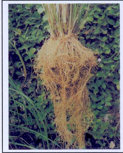
รากหญ้าแฝกเป็นระบบรากฝอย

3. ราก ( Roots ) รากเป็นส่วนสำคัญและเป็นลักษณะพิเศษของหญ้าแฝกที่ถูกนำมาใช้ประโยชน์เป็นหลัก หญ้าส่วนใหญ่โดยทั่วไปจะมีรากที่เป็นลักษณะระบบรากฝอย ( fibrous roots ) แตกจากส่วนลำต้นใต้ดินกระจายออกแผ่กว้างเพื่อยึดพื้นดินตามแนวนอน ( horizontal ) มีระบบรากในแนวตั้ง ( vertical ) ไม่ลึกมาก แต่ระบบของรากแฝกจะแตกต่างจากรากหญ้าส่วนใหญ่ทั่วไป คือมีรากที่สานกันแน่นหยั่งลึกแนวตั้งลงในดิน ไม่แผ่ขนาน มีรากแกน รากแขนงโดยเฉพาะมีรากฝอยแนวตั้งจำนวนมาก