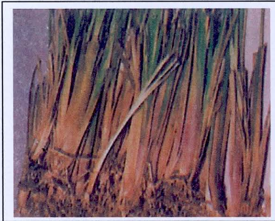
ต้นกล้าหญ้าแฝก