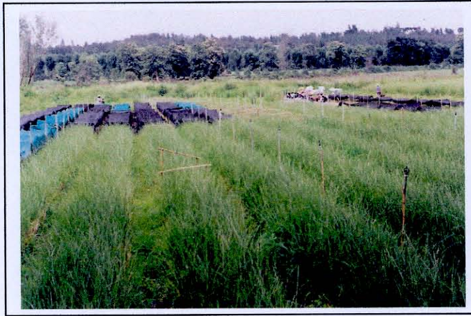
การปลูกหญ้าแฝกลงดินในแปลงยกร่อง

2. การปลูกลงดินในแปลงขนาดใหญ่ วิธีการนี้เป็นการขยายพันธุ์แปลงใหญ่เหมาะสำหรับหน่วยงานหรือเกษตรกรรายใหญ่ที่ต้องการใช้ต้นกล้าหญ้าแฝกจำนวนมาก และเป็นวิธีที่เหมาะสมสำหรับพื้นที่ที่ไม่มีการชลประทาน ขั้นตอนในการดำเนินการคล้ายคลึงกับวิธีการที่ 2 คือหลังการไถพรวนพื้นที่เป็นอย่างดีแล้ว จะนำหน่อพันธุ์หญ้าแฝกที่เตรียมไว้ปลูกลงในแปลงในขณะที่ดินมีความชุ่มชื้น ควรใช้หน่อพันธุ์หลุมละ 2-3 หน่อ โดยใช้ระยะปลูก 50 x 50 เซนติเมตร และเพื่อความสะดวกในการดูแลรักษา ควรปลูกเป็นแถวตามระยะปลูกดังกล่าว จำนวน 6 แถว และเว้นสำหรับเป็นทางเดิน 1 - 1.5 เมตร สลับกันไป การดูแลรักษาและการใส่ปุ๋ยเช่นเดียวกับการปลูกแบบยกร่อง ส่วนฤดูกาลที่เหมาะสมในการขยายพันธุ์แบบนี้ ควรดำเนินการในช่วงกลางฤดูฝน หรือระหว่างกลางเดือนมิถุนายนถึงกลางเดือนสิงหาคม การขยายพันธุ์โดยวิธีนี้ เมื่อหญ้าแฝกมีอายุ 4-5 เดือน จะให้ผลผลิตหน่อหญ้าแฝกเฉลี่ยกอละ 50 หน่อ