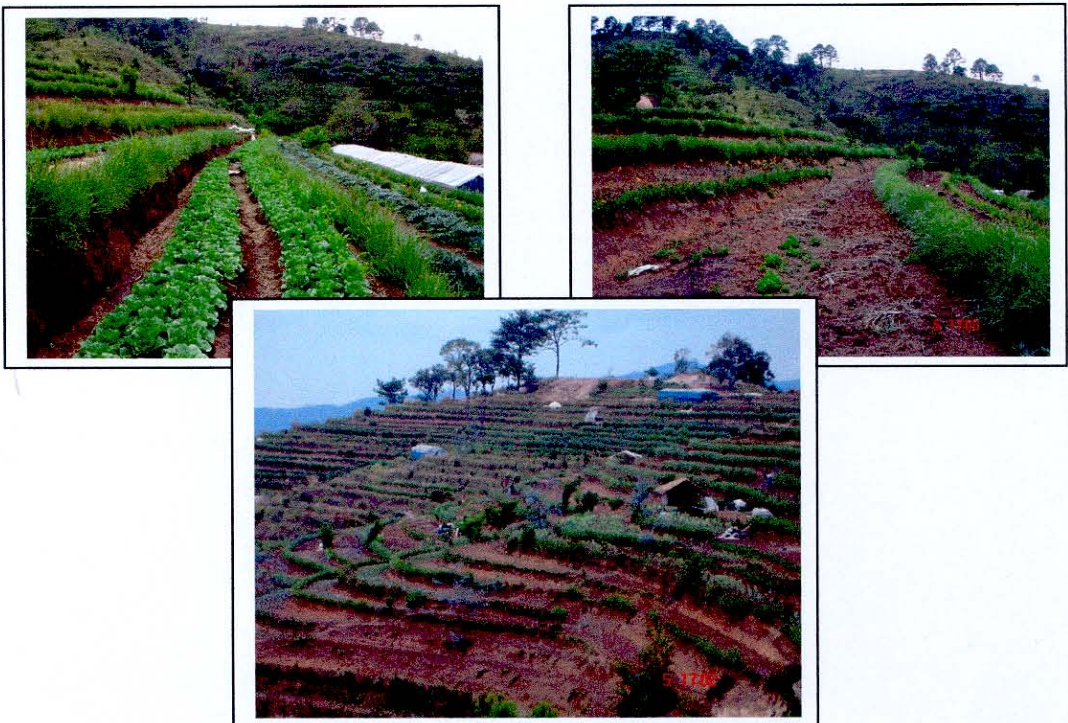
การปลูกหญ้าแฝกเสริมมาตรการอนุรักษ์ดินและน้ำวิธีกล

มาตรการอนุรักษ์ดินและน้ำด้วยวิธีกล เช่น คันดินเบนน้ำ คูรับน้ำขอบเขา ชั้นบันไดดิน ชั้นบันไดไม้ผลแบบระดับ และคันดิน เป็นมาตรการอนุรักษ์ดินและน้ำที่ก่อสร้างขึ้นเพื่อป้องกันการพังทลายของดินอันเนื่องมาจากน้ำไหลบ่าและเพื่อรักษาความชุ่มชื้นและความอุดมสมบูรณ์ของดิน ซึ่งเป็นวิธีการที่ต้องใช้งบประมาณในการก่อสร้างสูงมาก เกษตรกรไม่สามารถดำเนินการเองได้รัฐบาลจึงต้องให้การสนับสนุน การที่จะทำให้มาตรการอนุรักษ์ดินและน้ำด้วยวิธีกลให้มีประสิทธิภาพเพิ่มขึ้นและมั่นคงแข็งแรงมีอายุการใช้งานได้นานขึ้นนั้น หญ้าแฝกเป็นพืชที่มีความเหมาะสมในการปลูกเสริมมาตรการอนุรักษ์ดินและน้ำที่กล่าวมาข้างต้นได้เป็นอย่างดี โดยการใช้ต้นกล้าหญ้าแฝกแบบรากเปลือยหรือแบบปักชำถุงก็ได้ ทำการปลูกเป็นแถวระดับบริเวณไหล่ระบบอนุรักษ์ดินและน้ำ หรือไหล่คันดิน และเมื่อแถบหญ้าแฝกที่ปลูกเจริญเติบโตเบียดกอชิดติดกันแน่น จะกรองตะกอนดินที่ถูกพัดพามากับน้ำไหลบ่าไม่ให้มาตกทับถมบริเวณที่ราบของระบบอนุรักษ์โดยให้ติดค้างอยู่ที่แถบหญ้าแฝก และระบบรากของหญ้าแฝกยังช่วยยึดดินรอบๆ ไหล่ระบบอนุรักษ์ไม่ให้เกิดการพังทลายของดินได้