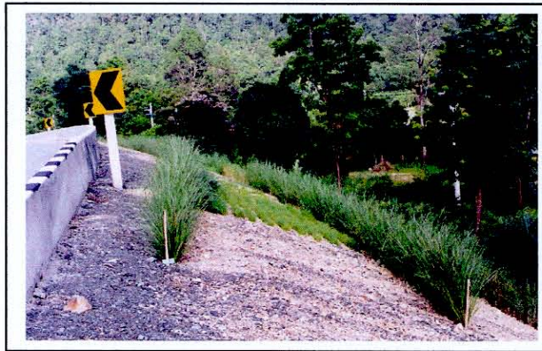
การปลูกหญ้าแฝกไหลถนน

1.4 การปลูกหญ้าแฝกไหลถนน โดยปลูกหญ้าแฝกเป็นแถวตามแนวระดับขวางความลาดเท บริเวณไหลถนน แต่ละแถวห่างกัน 1 – 2 เมตร จำนวนแถวที่ปลูกขึ้นอยู่กับความลึกและความสูงของไหลถนน เพราะแถบหญ้าแฝกที่ปลูกเมื่อเจริญเติบโตเบียดกอชิดติดกันแน่น จะกรองตะกอนดินที่ถูกพัดพามากับน้ำไหลบ่าไม่ให้มาตกทับถมบริเวณผิวจราจรให้ติดค้างอยู่ที่แถบหญ้าแฝก และระบปรากของหญ้าแฝกยังช่วยยึดดินรอบๆไหลถนนไม่ให้เกิดการพังทลายของดินบริเวณไหลถนนได้