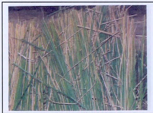
ลักษณะของใบหญ้าแฝก

2. ใบ ( Leaf ) ใบของหญ้าแฝกจะแตกออกจากโคนกอ มีลักษณะแคบยาวขอบใบขนานปลายสอบแหลมแผ่นใบกว้างคายน โดยเฉพาะใบแก่ขอบและเส้นกลางใบมีหนามละเอียด ( spinulose ) หนามบนใบที่ส่วนโคนและกลางแผ่นจะมีน้อยแต่จะมีมากที่บริเวณปลายใบมีลักษณะตั้งทแยงปลายหนามชี้ขึ้นไปทางปลายใบ กระจิ่งหรือเยื่อกันน้ำฝนที่โคนใบ ( Ligule ) จะลดรูปมีลักษณะเป็นเพียงส่วนโค้งของขนสั้นละเอียด บางครั้งสังเกตได้ไม่ชัดเจน