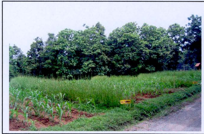
การใช้หญ้าแฝกปลูกเป็นมาตรการอนุรักษ์ดินและน้ำ

รบกวนรากของพืชอื่นที่ปลูกอยู่ข้างเคียง รากหญ้าแฝกเปรียบเสมือนกำแพงใต้ดิน ซึ่งจะทำหน้าที่เกาะยึดดิน สงวนน้ำในดิน กรองและดูดซับธาตุอาหารพืชและสารเคมีลดมลพิษให้กับสภาพแวดล้อม ส่วนลำต้นที่ปลูกเป็นแถวเป็นแนวตามระดับในพื้นที่ลาดชัน และไหลถ่นน เมื่อเจริญเติบโตแตกกอเบียดชิดติดกัน จะทำหน้าที่เสมือนแนวรั้วช่วยในการเก็บกักตะกอนดินกรองเศษซากพืชและปล่อยให้บางส่วนหนึ่งไหลผ่านไปได้ ซึ่งจะช่วยลดการชะล้างพังทลายของดินและการไหลบ่าหน้าดินของน้ำได้อย่างมีประสิทธิภาพ และการปลูกหญ้าแฝกเสริมระบบอนุรักษ์ดินและน้ำด้วยวิธีการ เช่น ปลูกหญ้าแฝกเสริมคันดินบนน้ำ คันดิน อนุรักษ์น้ำขอบเขา ขึ้นบันไดไม้ผลแบบระดับ และขึ้นบันไดปลูกพืช เมื่อแฝกที่ปลูกเจริญเติบโตแตกกอเบียดชิดติดกันก็จะทำหน้าที่ช่วยเสริมระบบให้มีความแข็งแรงไม่พังทลายได้ง่ายและยังเป็นการทำให้ระบบมีอายุการใช้งานได้ยาวนานขึ้นอีกด้วย