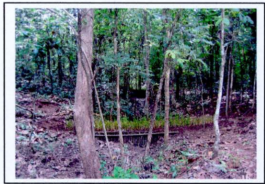
การปลูกหญ้าแฝกตามร่องน้ำ