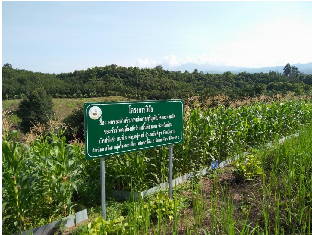
ภาพภาคผนวกที่ 5 ต้นข้าวโพดเลี้ยงสัตว์ ตามดำรับการทดลอง