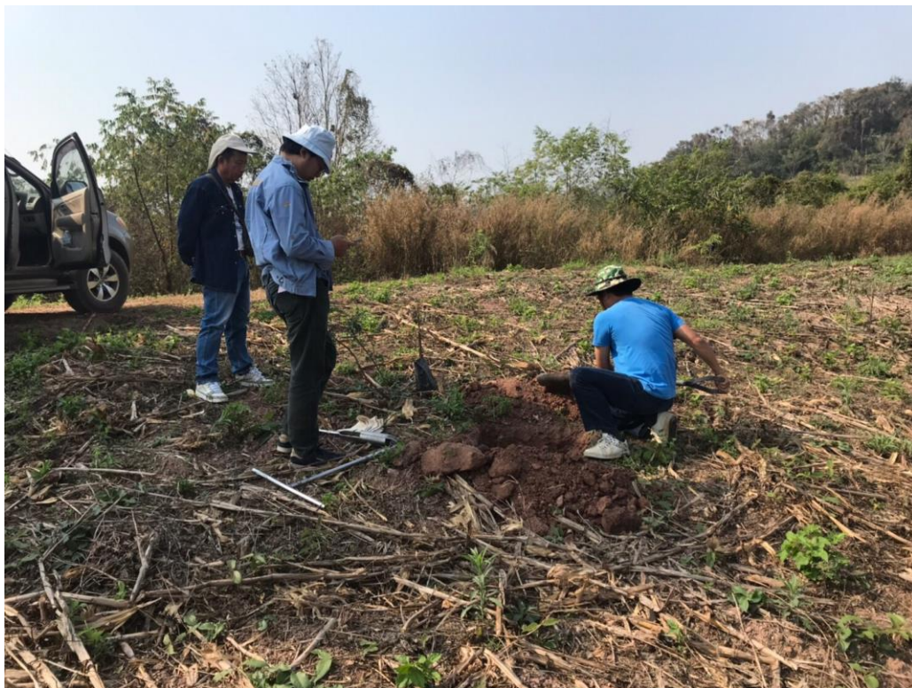
ภาพภาคผนวกที่ 2 การสำรวจดิน และจำแนกดิน พบว่า เป็นชุดดินวังสะพุง กลุ่มชุดดินที่ 55