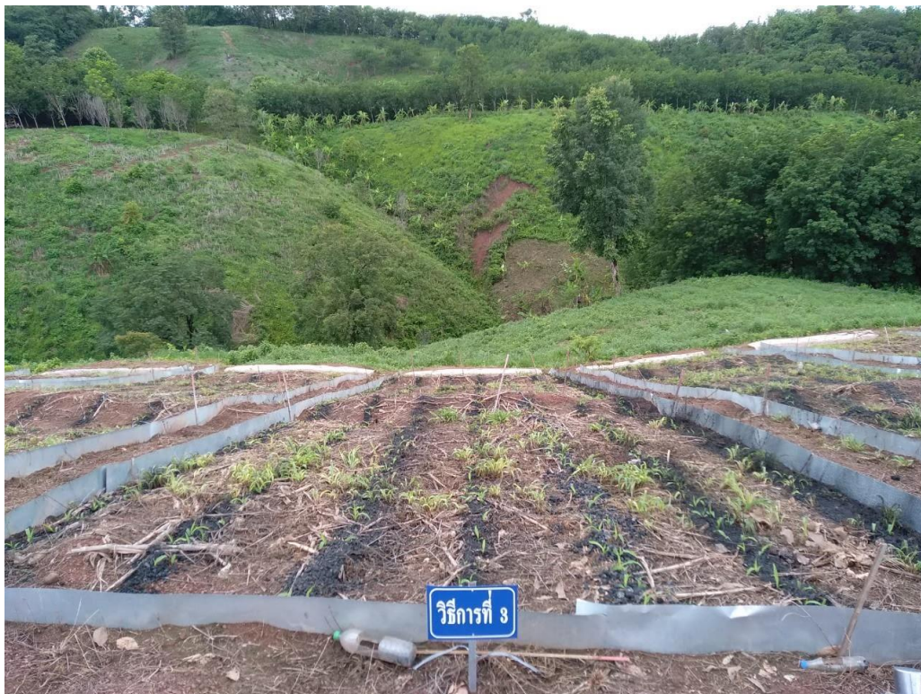
ภาพภาคผนวกที่ 4 การใช้ถ่านชีวภาพ และปุ๋ยหมัก ตามตำรับการทดลอง