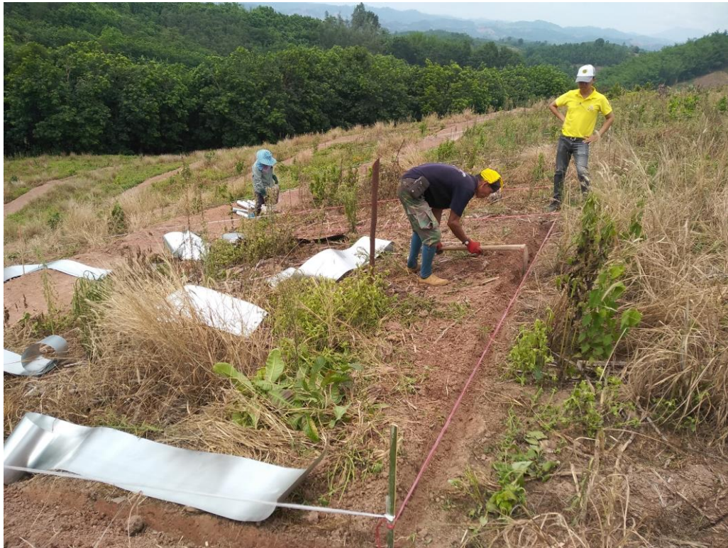
ภาพภาคผนวกที่ 3 การวางผังแปลงทดลอง พร้อมฝังสังกะสีรอบขอบแปลง