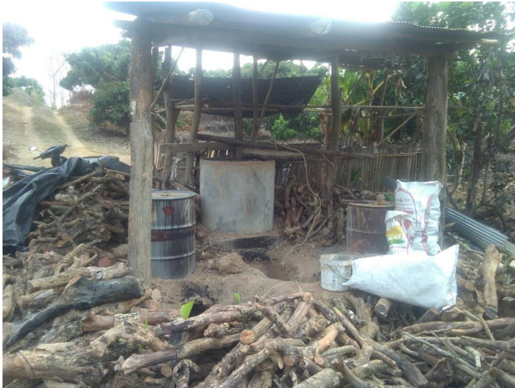
ภาพภาคผนวกที่ 1 เตาเผาถ่านชีวภาพแบบชาวบ้าน โดยใช้เศษไม้ลำไย ซึ่งมีมากในจังหวัดน่าน